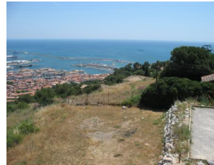
Vue du Mont St Clair sur l'étang