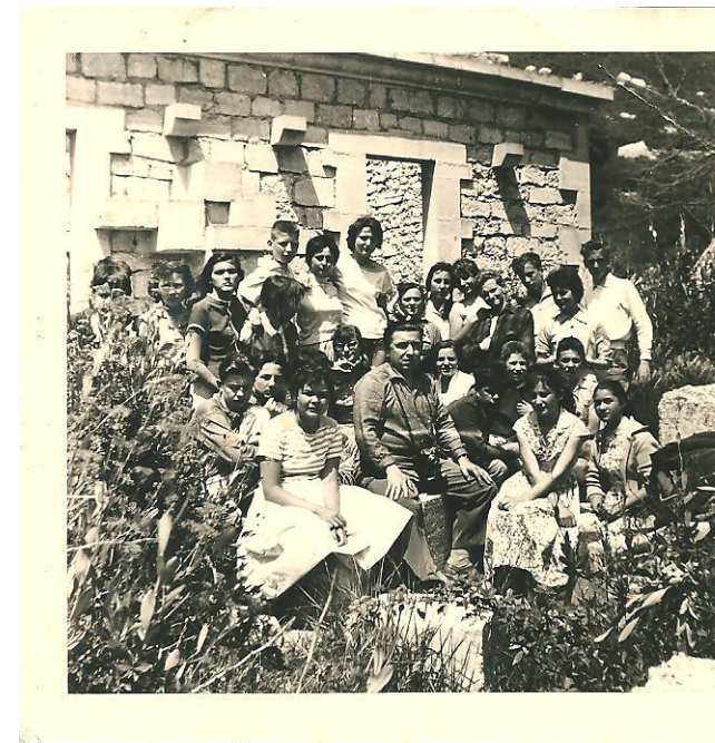
SORTIE FIN D'ANNEE AU VENTOUX 1957