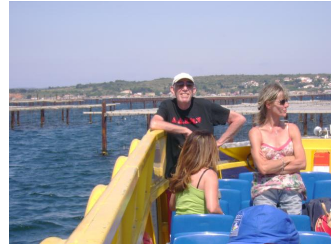
L'Etang de Thau : les tables