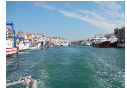
Canal de Sète : départ de la balade

Le lendemain, visite de l'Etang de Thau au départ de Sète, citée bâtie au pied du Mont Saint Clair, port de pêche et de commerce. L'étang de Thau est le plus étendu et le plus profond des étangs du Languedoc. Un bateau à vision sous-marine nous a permis d'admirer le dessous des « tables » où se développent les coquillages, rappelons que la moitié de la production française d'huitres provient de ce lieu. Un pique-nique au Mont Saint Clair où la vue est imprenable mettait une touche finale à ce paisible week-end.