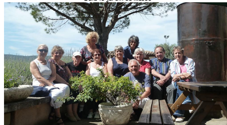
Dans le jardin du musée

Nous visitons ensuite l'église du XI e siècle de Saint-Pantaléon avant le pique-nique et le retour, nos yeux et nos estomacs bien rassasiés.