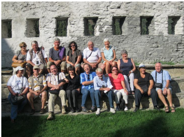
Sur les remparts du château