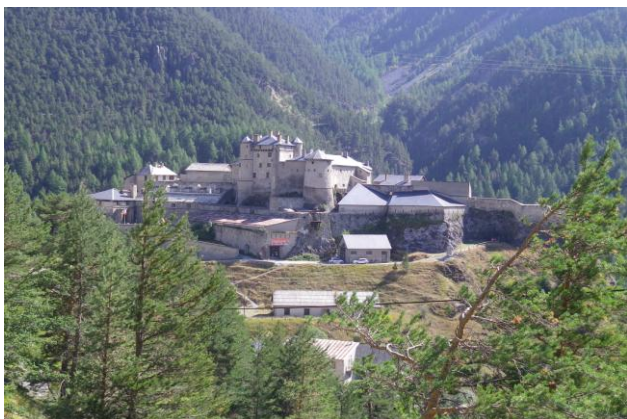
Vue générale de Château Queyras

Visite détaillée, intéressante et sympathique, qui a duré presque deux fois plus que prévu et qui s'est terminée par une dégustation d'hypocras offerte par le propriétaire, boisson découverte à cette occasion par beaucoup d'entre nous.