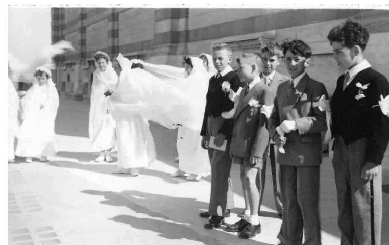
Les communiants de Marseillevyre